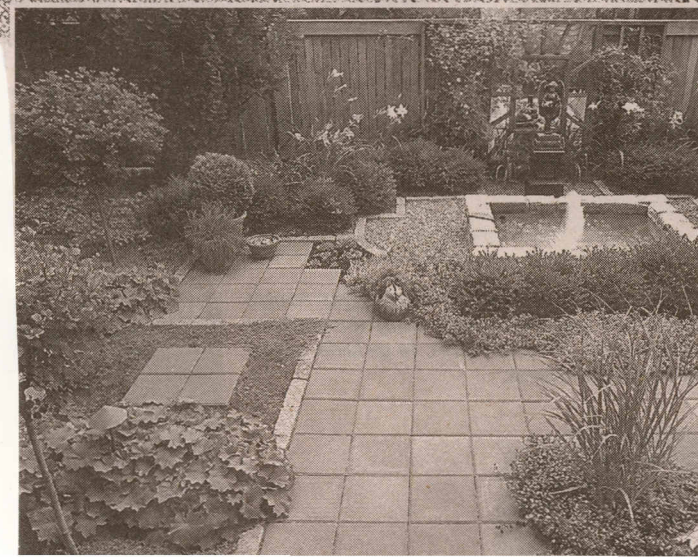
Deux angles de l'aménagement qui a valu le prestigieux prix Milan Havlin à Art & Jardins, en Montérégie.