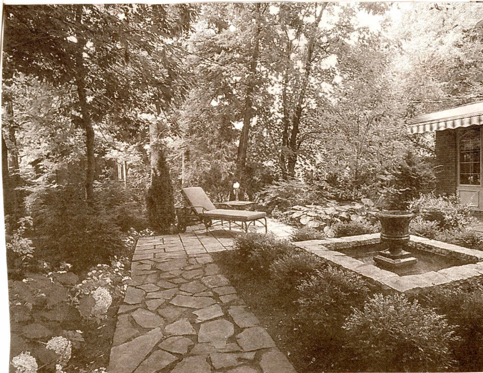
Le lauréat dans la catégorie de la métamorphose réussie: Art & Jardins.